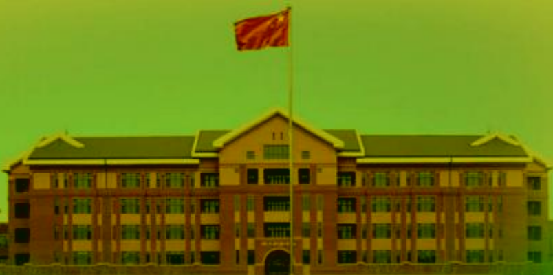
天津机电职业技术学院

TIANJIN VOCATIONAL COLLEGE OF MECHANICAL AND ELECTRICAL ENGINEERING